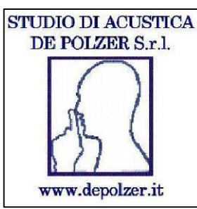
TAVOLA 8.1 I parte

Studio di Acustica de Polzer s.r.l. Via S. Maria 2, 34131 Trieste, Italia Tel e fax: 0432/917034 - 0432/917042 Email: info@polzer.it